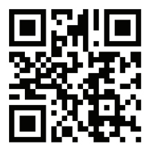
School Website 學校網頁