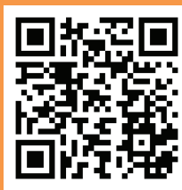
School Facebook 學校專頁