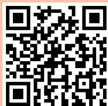
升小校方 WhatsApp 群組